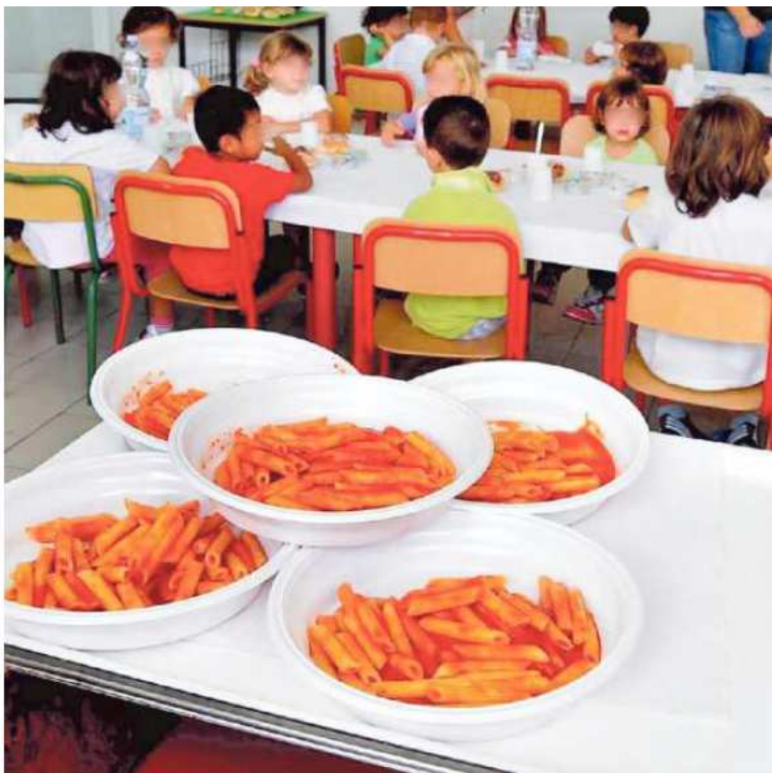
I pasti sono una voce importante nei bilanci delle scuole paritarie

«Per due motivi: il numero insufficiente di posti nei corsi di laurea di Scienze della formazione primaria a Padova e Verona e per il fatto che i numeri dei bambini accolti nelle paritarie è superiore rispetto alla media nazionale: da noi due